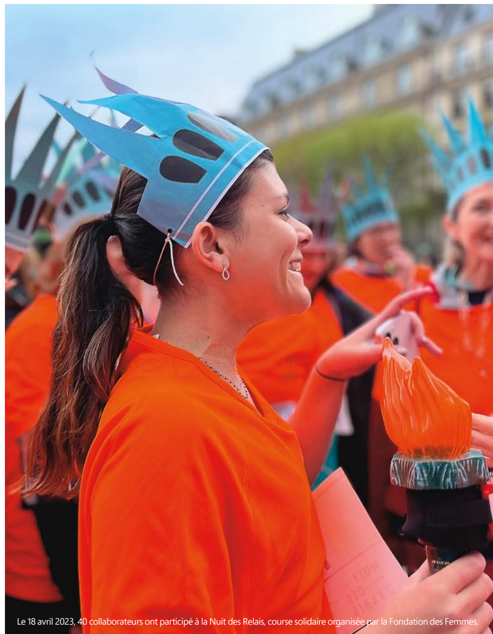
Le 18 avril 2023, 40 collaborateurs ont participé à la Nuit des Relais, course solidaire organisée par la Fondation des Femmes.

Capital Filles permet à des jeunes filles issues de quartiers populaires ou de territoires ruraux d'être accompagnées par une marraine du monde de l'entreprise. Sur l'année scolaire 2023-2024, 96 mairaines collaboratrices de Covéa ont conseillé et guidé, chacune, une jeune fille.