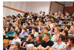
^ Participation d'étudiants à un colloque du Collège de France.